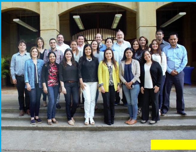
RRHH Mod3 INCAE