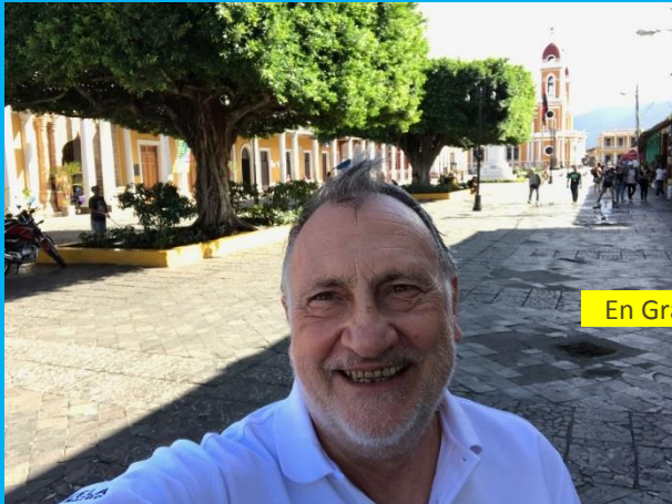
En Granada (Nicaragua)