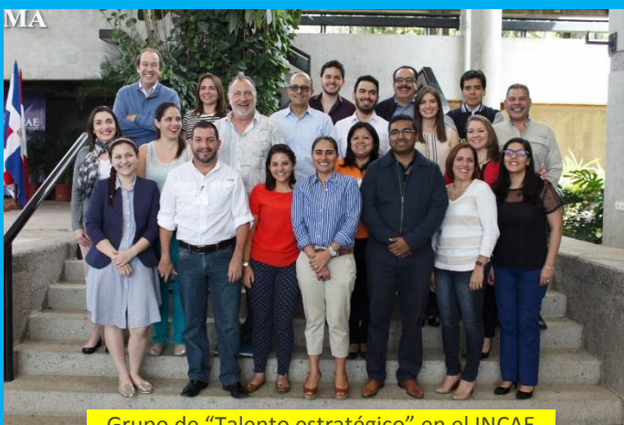
Grupo de "Talento estratégico" en el INCAE