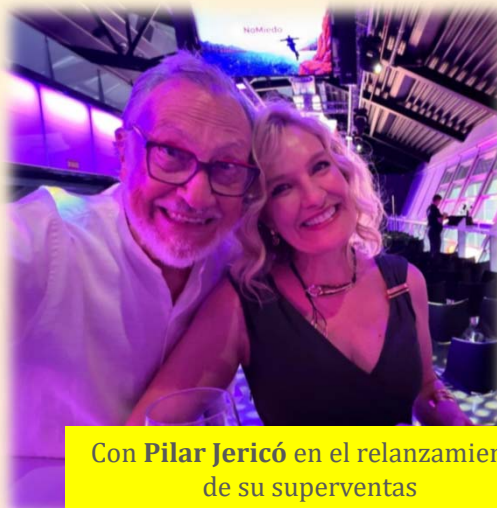
Con Pilar Jericó en el relanzamiento de su superventas