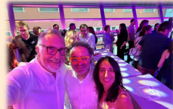
Con Rosalía y mago More en el relanzamiento de “No miedo”